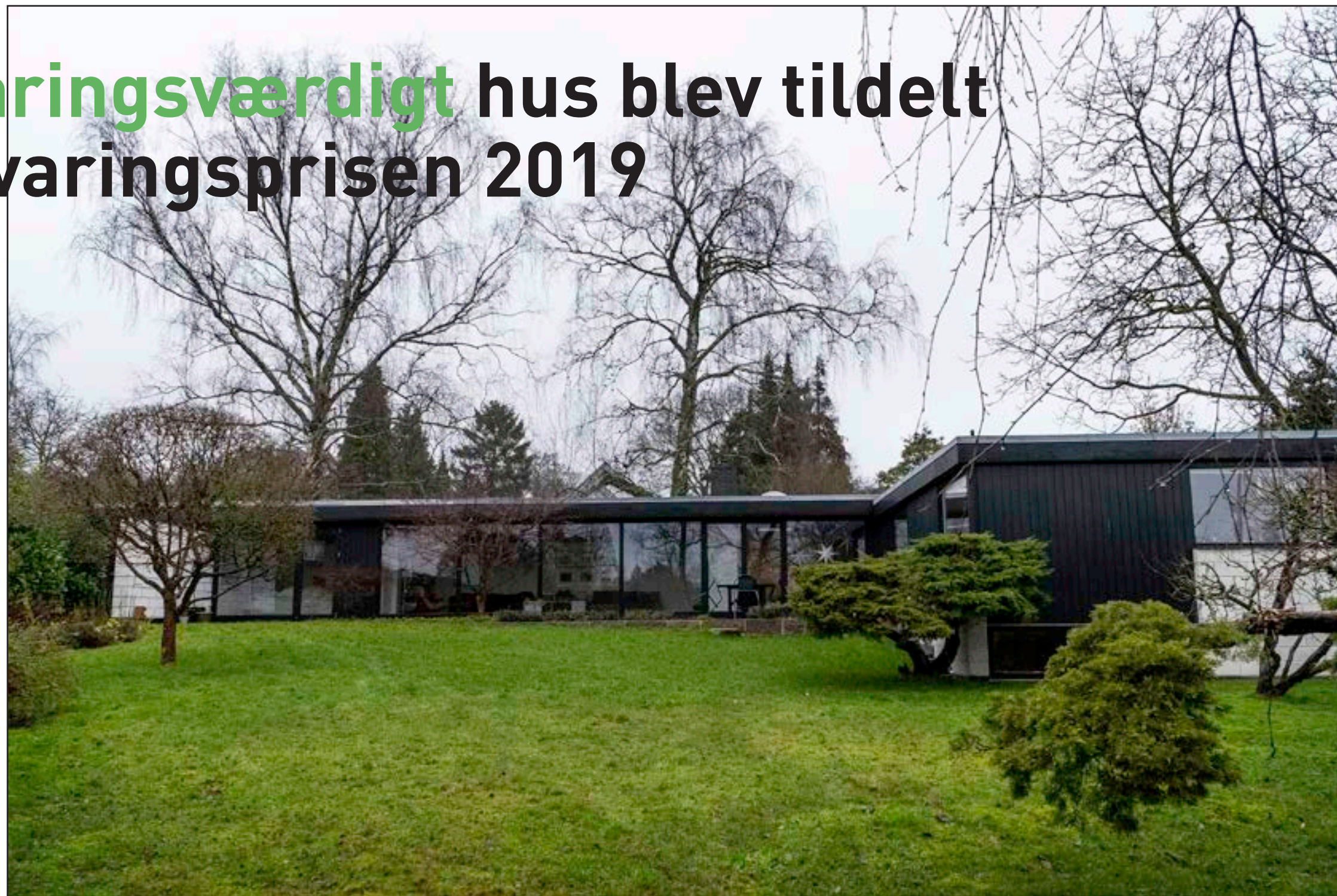
Arkitektur- og Bevaringsprisen blev givet til Søllerødgårdsvej 34 i Holte.

- Og så skal vi ikke glemme, at vi også skal skabe plads til den nytænkende arkitektur af høj kvalitet, fx når man kaster sig ud i ombygninger eller tilbygninger. For det er altid værd at anerkende, når nogen har gjort sig umage. Og det er det, vi gør i dag.