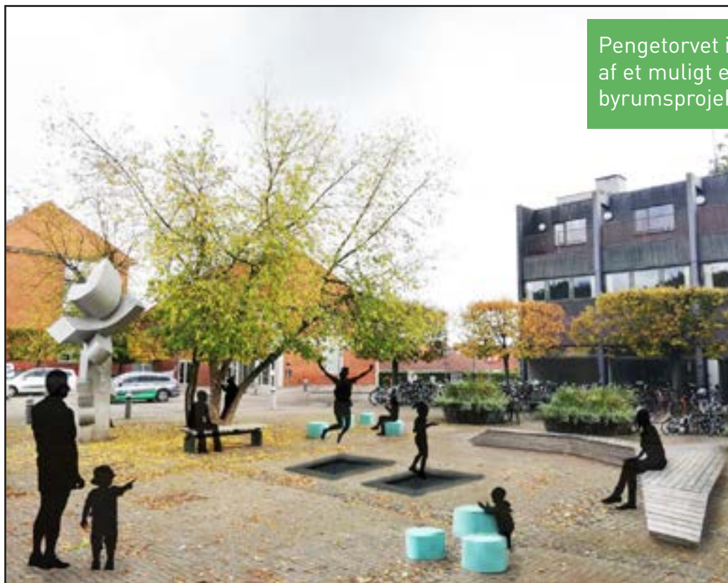
Pengetorvet i Birkerød, visualisering af et muligt element i det kommende byrumsprojekt.